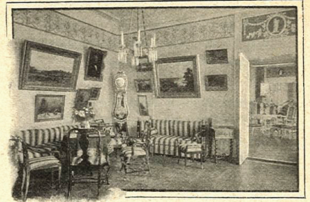
SCHEDEVI: LILLA SALONGEN.