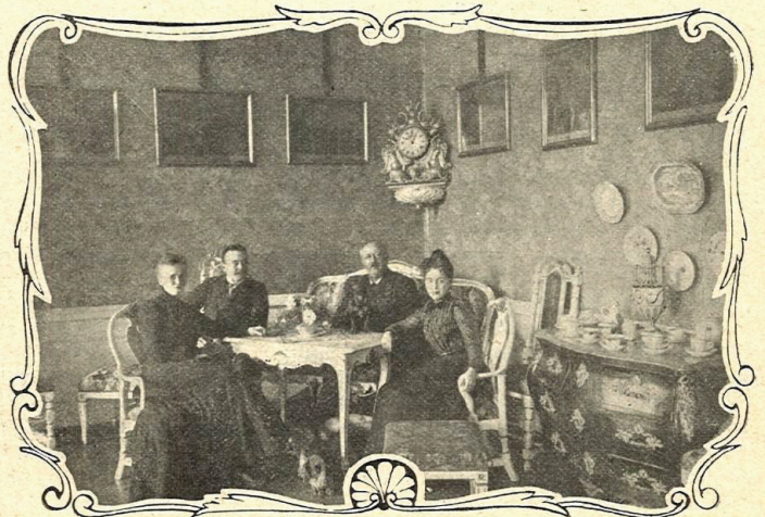
FAMILJEN Å SCHEDEVI SAMLAD I STORA SALONGEN.

KAMRATEN , illustrerad tidning för Sveriges ungdom, är Nordens förnämsta och mest omtyckta ungdomsblad och kostar för helt år endast 3 kr.