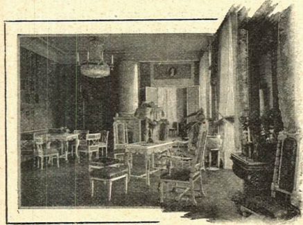
SCHEDEVI: STORA SALONGEN.

Nej, »Gammal mor!» skola bildade flickor komma bort på så sätt, så skola de också njuta hemmets hägn. I mitt tycke är — förlåt — »Gammal mor» allt för själfvisk. De s. k. bildade flickorna äro, efter hvad jag erfart ej bättre att handskas med än tjänarne, så äfven de behöfva nog i mycket uppfostras. Jag har aldrig haft så mycket obehag af min jungfru, som jag haft af de bildade flickor jag haft i mitt hem, dels inackorderade, dels